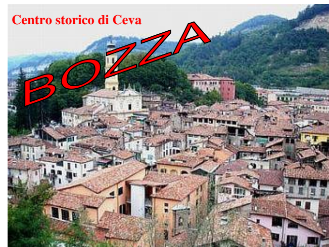
Centro storico di Ceva

4° tratto 2 - 3 giugno 2012: da Cuneo a Savona